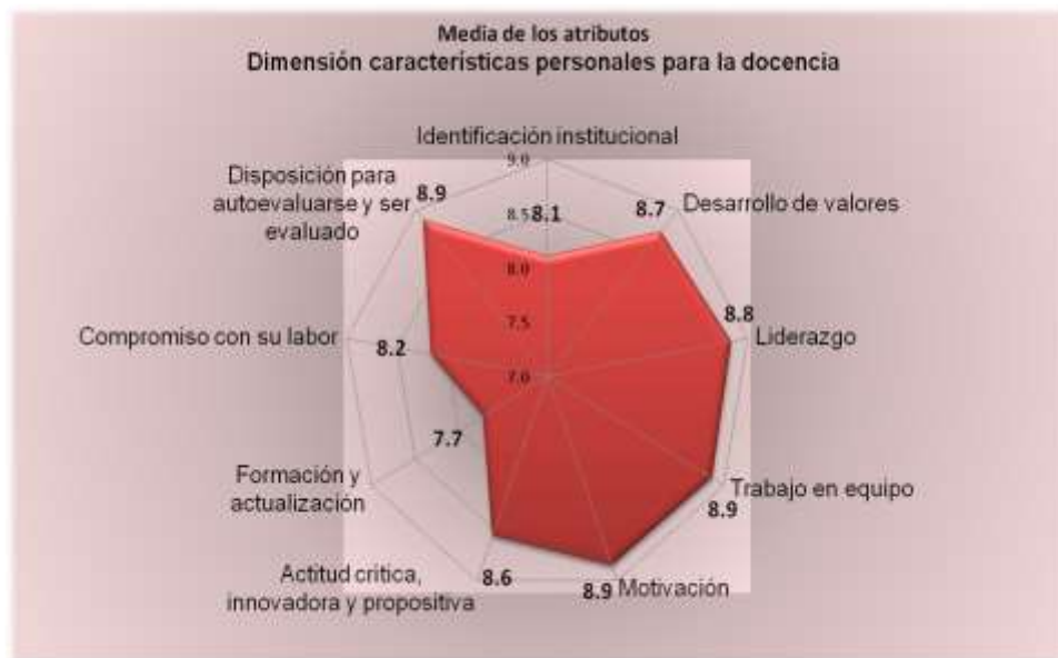
Figura 2. Resultados de la dimensión características personales para la docencia

Respecto a las características personales para la docencia, estas promueven el cumplimiento eficaz de la labor docente y su valoración se presenta en la figura 2. En el mismo nivel de valoración con una media de 8.9 se ubica la actitud y habilidad para el trabajo en equipo mediante el empleo de diversas actividades, la habilidad para motivar a través del uso de estrategias que invitan a los estudiantes a aprender el idioma ; y la disposición para autoevaluarse y ser evaluado con la intención de mejorar su desempeño docente.