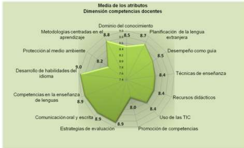
Figura 3. Resultados de la dimensión características personales para la docencia

Al ser las competencias docentes un conjunto identificable y evaluable de conocimientos habilidades y actitudes que permiten el desempeño satisfactorio en situaciones reales de la práctica profesional, en la figura 3 se observa la valoración de los atributos incluidos en esta dimensión.