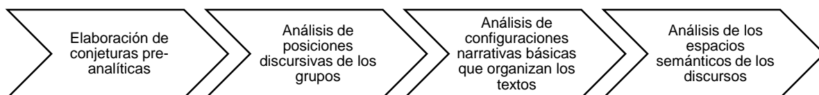
Figura 1. Proceso general de análisis de datos cualitativos inspirado en la propuesta de Conde (2010).

Como parte del proceso para la interpretación y análisis de los discursos, se contemplan cuatro etapas (figura 1):