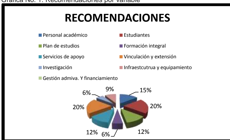
Gráfica No. 1: Recomendaciones por variable

El plan de cualquier institución educativa es dar cumplimiento a su misión y visión organizacional, en donde queda claramente estipulado lograr la calidad y excelencia académica en todos sus procesos. El programa educativo en cuestión ha sido evaluado y acreditado por El Consejo de Acreditación en la Enseñanza de la Contaduría y Administración, y los resultados son los siguientes