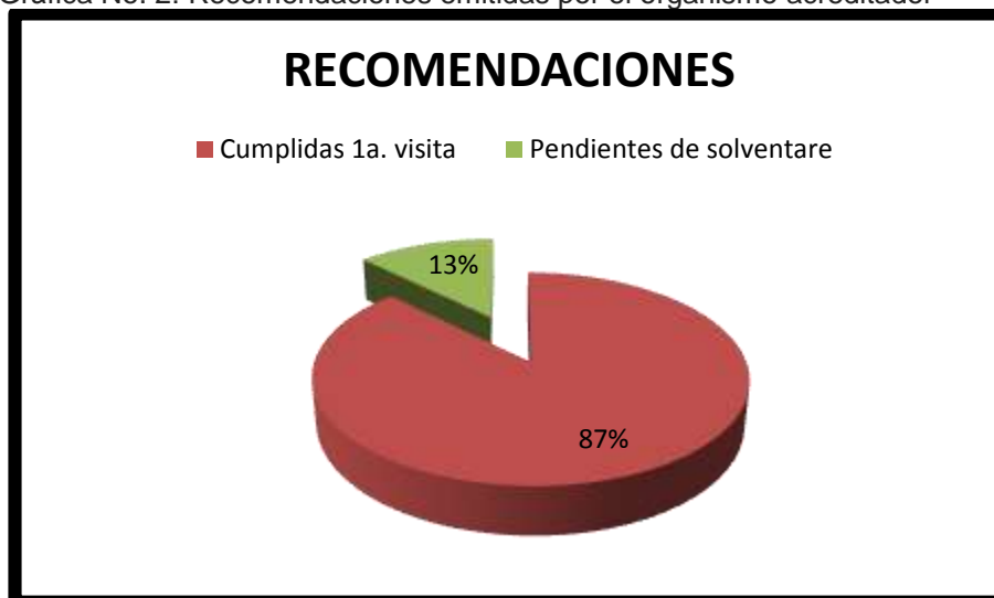
Gráfica No. 2: Recomendaciones emitidas por el organismo acreditador