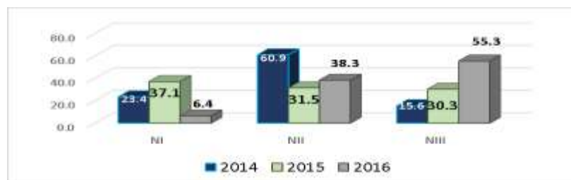
Gráfica 4. Nivel de desempeño obtenido por las egresadas en el Examen de Conocimientos y Habilidades para la Práctica Docente (CHPD). Porcentaje según año de egreso.