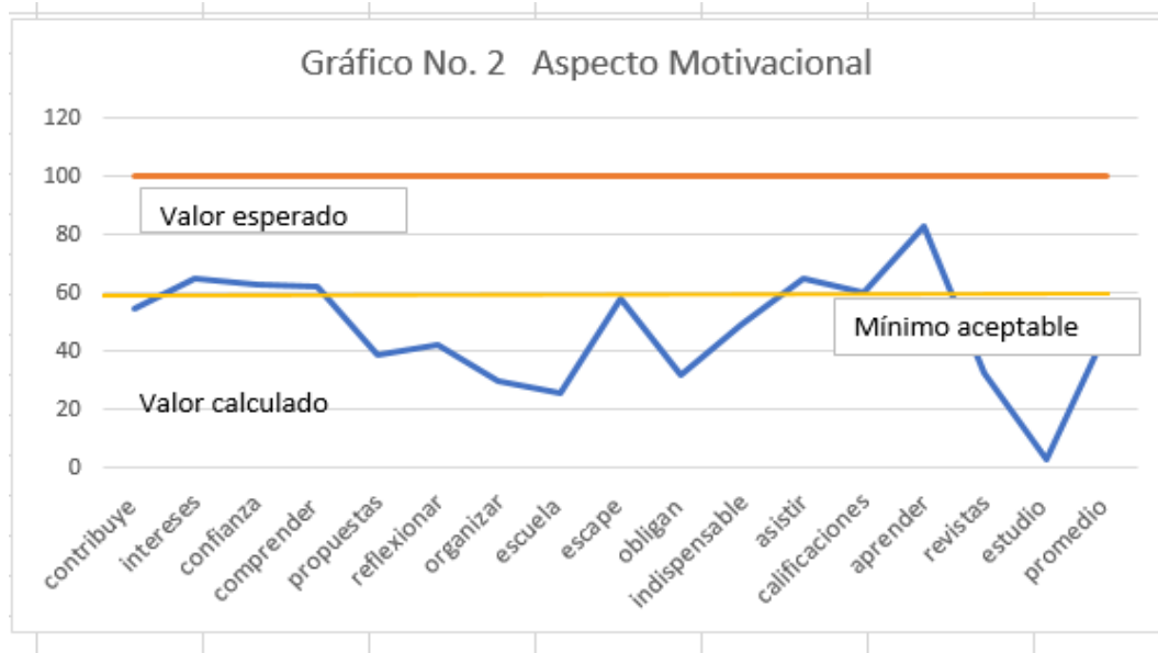
Gráfico No. 2 Aspecto motivacional

En el gráfico número 2 se muestra con claridad que los estudiantes manifiestan bajos niveles de motivación para poder desempeñarse de manera óptima pues reflejan falta de interés para superarse, el porcentaje de respuesta positiva a la superación lo manifiestan en un 32%; para asistir a clases en un 74% de respuesta positiva en favor de asistir a clases que es un aliciente, sin embargo es preocupante el otro 26% alcanzado en el que consideran una pérdida de tiempo y gasto inútil con un 65% manifiesta tienen interés de participar sin embargo reconocen con un 62 % su incapacidad para entender conocimientos nuevos. Y no están motivados a ser más activos en la participación de aprender de compañeros y maestros.