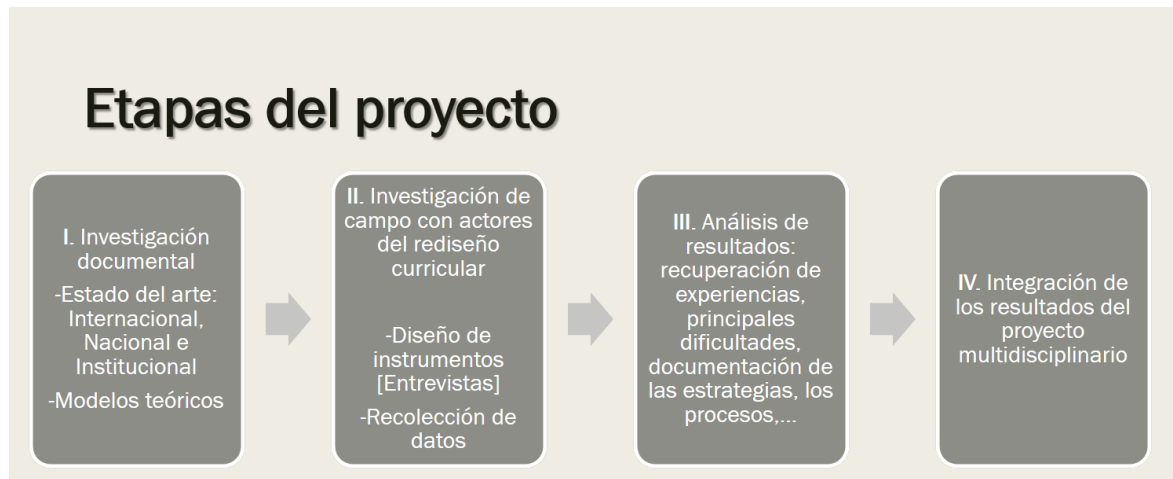
Figura 2. Etapas del proyecto de investigación. Elaboración propia.