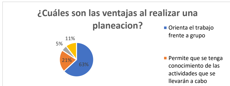
Gráfico 2 . ¿Cuáles son las ventajas al realizar una planeación?

de tal manera pueden diseñar planeaciones acordes a las condiciones de su escuela y sus necesidades para un aprendizaje significativo.