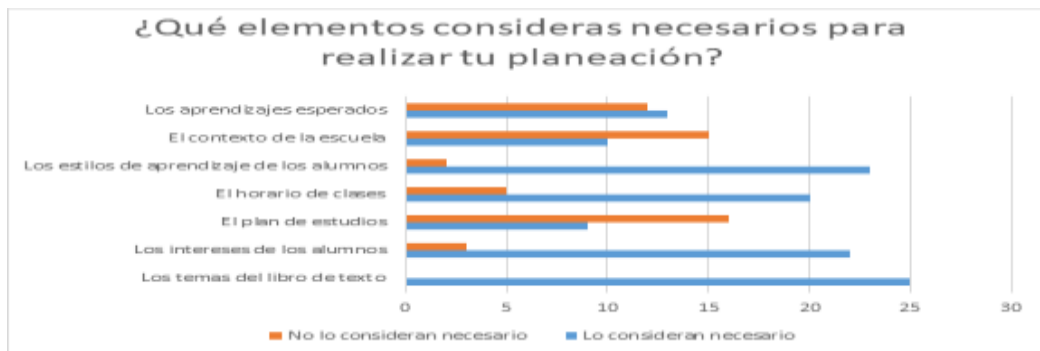
Gráfico 1. ¿Qué elementos consideras necesarios para realizar tu planeación?

Para el análisis del papel de la formación docente en los alumnos del 3° 11 de la BENM, se ha desarrollado una encuesta para obtener sus principales desafíos que se enfrentan en el diseño, creación y ejecución de una planeación didáctica. De tal forma se ha obtenido los siguientes resultados: