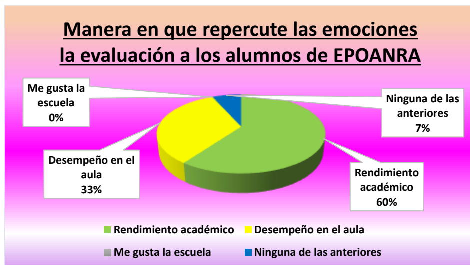
Figura 2: Manera en que repercute las emociones la evaluación a los alumnos de EPOANRA Aunado a lo anterior y al mismo tiempo a su misma consecuencia, dirigiendo la atención en la Figura 3, la emoción que generan con mayor frecuencia determinada al 67% es el miedo (negativa) y un 26.67% la alegría (positivo), abriendo paso a retomar la importancia que juegan aquellos sentimientos y emociones al llevar a cabo el proceso de evaluación, porque si se sigue replicando los pensamientos y modismos, generarán ciudadanos con temor a ser vistos de otra manera de la cual no son; emergiendo la erradicación de otorgar su cualidad, Palláres (2010).