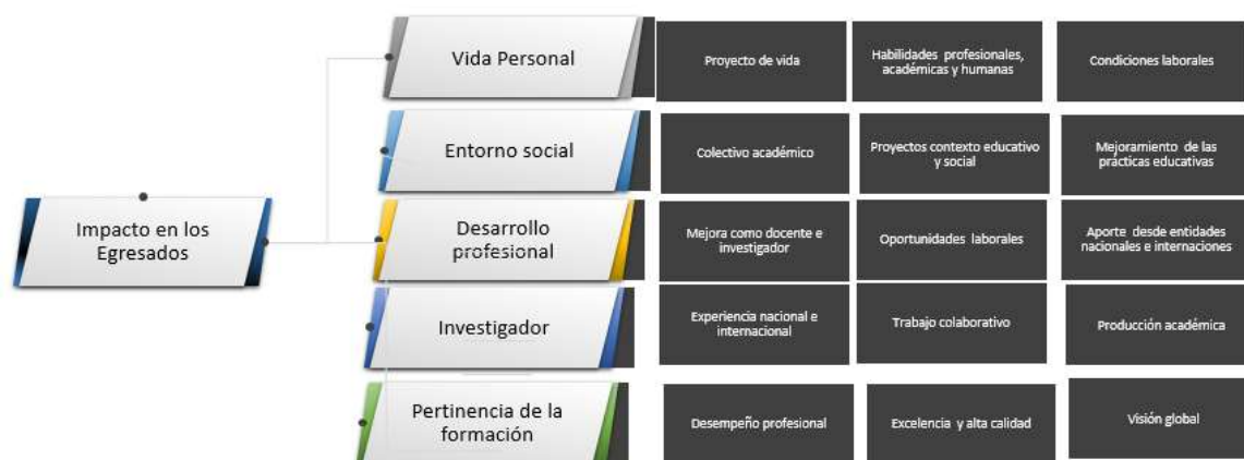
Figura 1 Impacto de egresados

Como se percibe en la Figura 1, los egresados reconocen impactos importantes en la vida personal en tanto la formación constituye una oportunidad de consolidación de su proyecto de vida al brindar habilidades profesionales, académicas y humanas que fortalecen sus competencias laborales, sociales y profesionales.