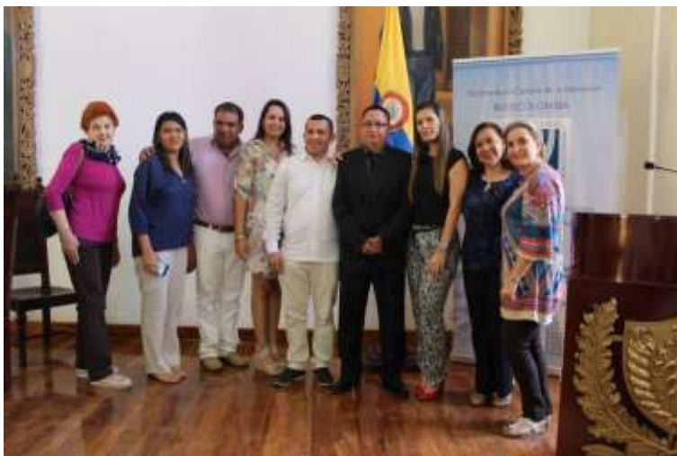
Colectivo de egresados del Doctorado en Ciencias de la Educación