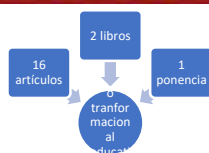
Gráfico 4. Frecuencia de documentos de búsqueda liderazgo transformacional educativo.