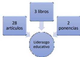
Gráfico 1. Frecuencia de documentos de búsqueda Liderazgo educativo.