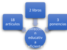
Gráfico 2. Frecuencia de documentos de búsqueda dirección educativa eficiente.