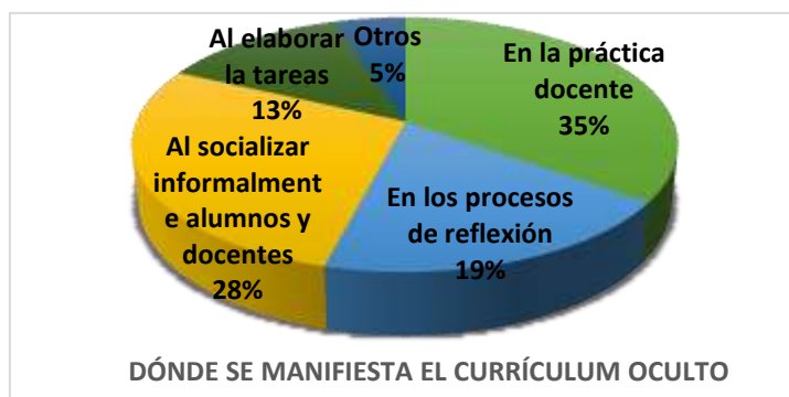
Figura 2 Gráfica expresando los porcentajes de las respuestas a la pregunta 2 del cuestionario aplicado a los alumnos

2.-¿En qué acciones o procesos consideras que se pone de manifiesto el currículum oculto?