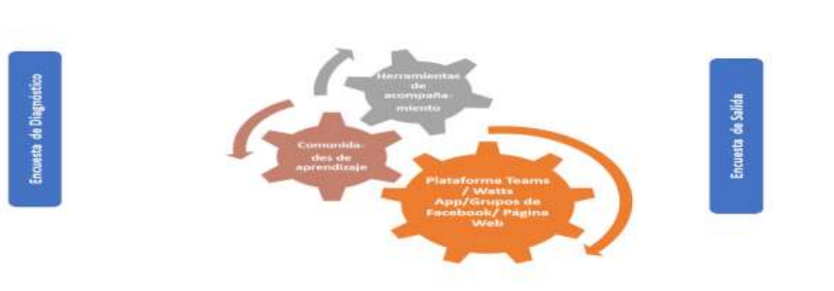
Figura 2. Ruta crítica de acompañamiento al docente.

acompañamiento como son: plataforma Teams, paginas Wix y las redes sociales Facebook, Watts App.