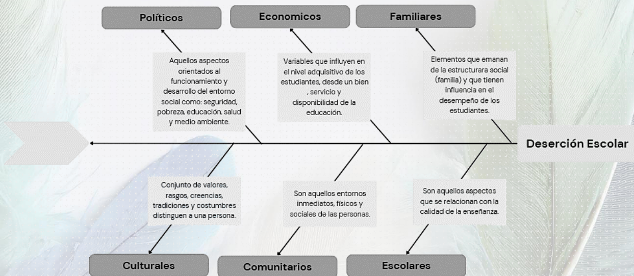
Diagrama de Ishikawa: Deserción escolar.