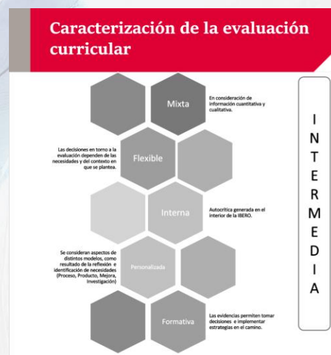
Figura 1. Caracterización de la evaluación curricular

A partir de lo anterior, se consideró entre las características de la evaluación curricular: