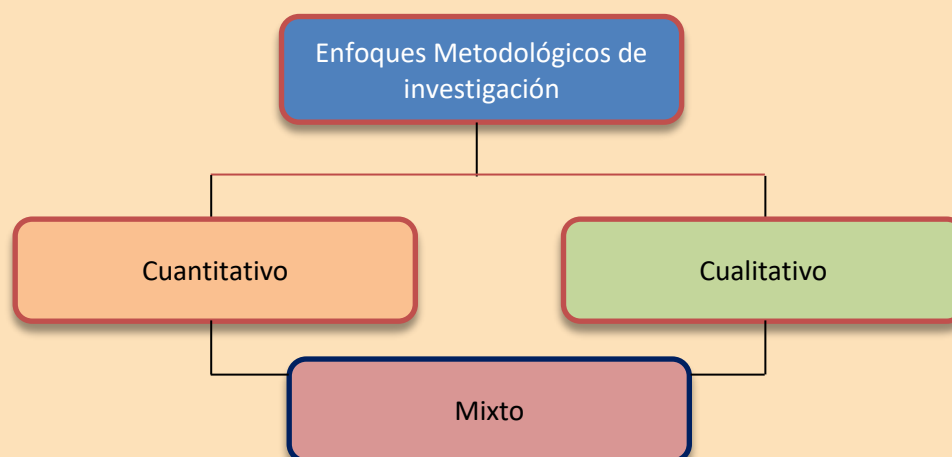
Figura 1. Los tipos de enfoques metodológicos de la investigación

Fuente: Retomados elementos de Campos (2010).