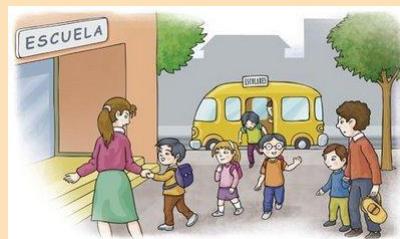
Entrada a la escuela