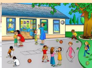
salir al recreo