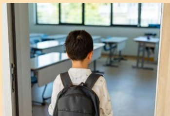
entrada al salón