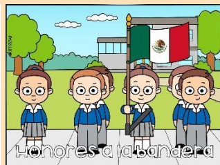
honores a la bandera