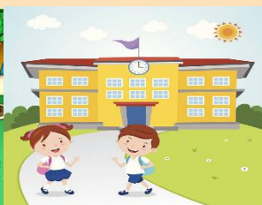
hora de la salida